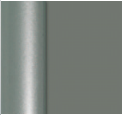
RAL 9007, Graualuminium