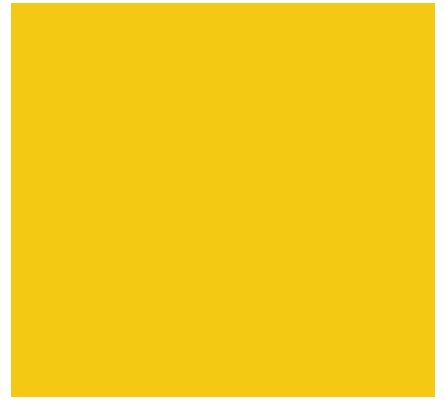
RAL 1004, Goldgelb