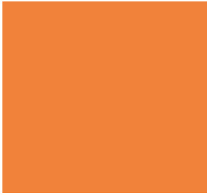
RAL 2003, Pastellorange