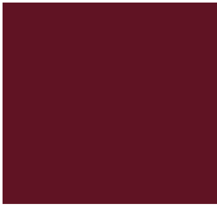
RAL 3005, Weinrot