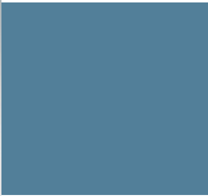
RAL 5014, Taubenblau