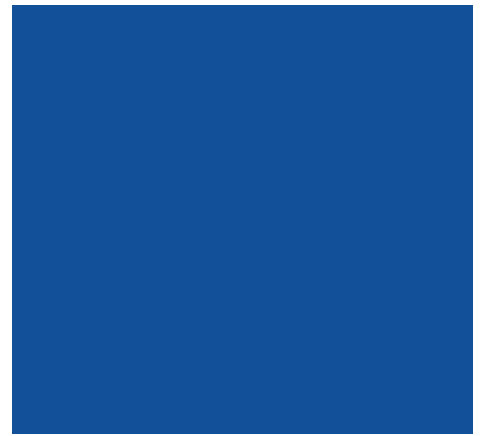
RAL 5002, Ultramarinblau